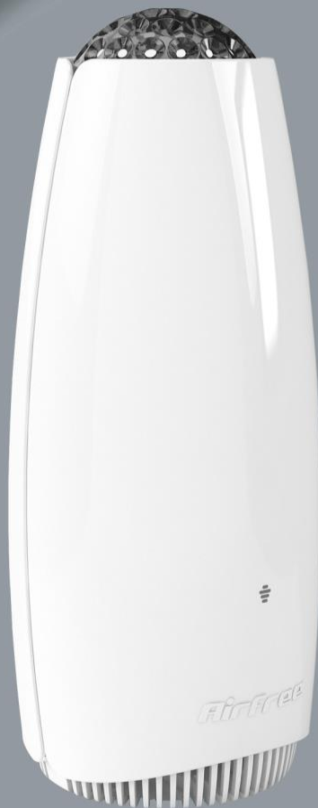
Airfree ® Tulip 80 / Babyair Tulip 80